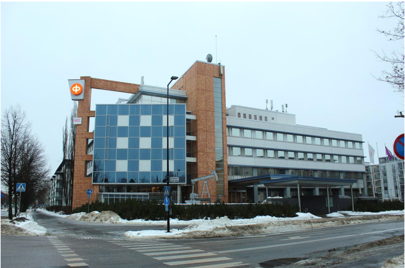
Neilikkatien toimistokiinteistö Vantaalla

Yhtiö pyrkii ottamaan energiatehokkuus- ja hiilineutraaliusvaateet huomioon toiminnassaan siten, että se soveltaa koeteltuja ja toimiviksi havaittuja keinoja.